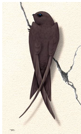
Illustrazione 1 : Tomasz Cofta